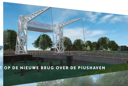
UITZICHT OP DE NIEUWE BRUG OVER DE PIUSHAVEN